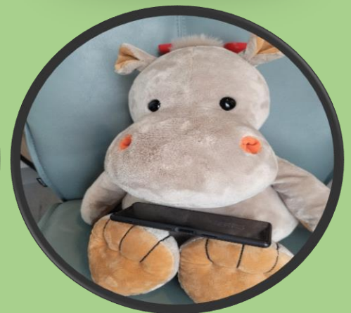
Se på telefonen