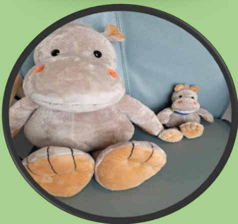
Holde i hånden