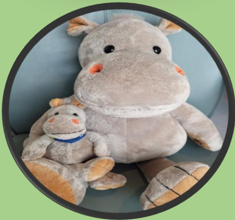
Sitte på fanget