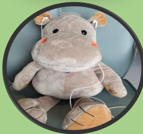
Høre på musikk