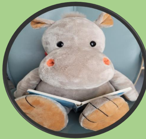
Lese en bok