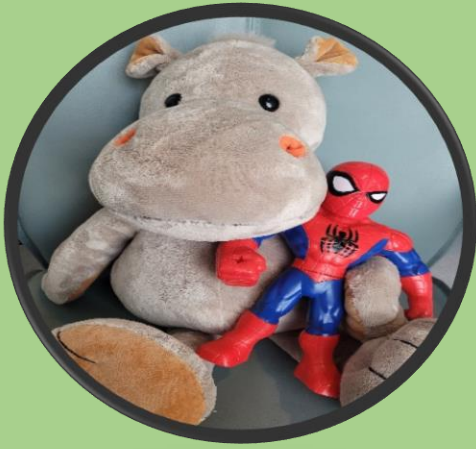
Ha bamse på fanget

Her er noen lure ting du kan gjøre når du skal ta blodprøve. Hva har du lyst å gjøre?