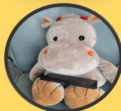
Se på telefonen