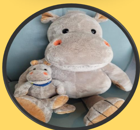
Sitte på fanget