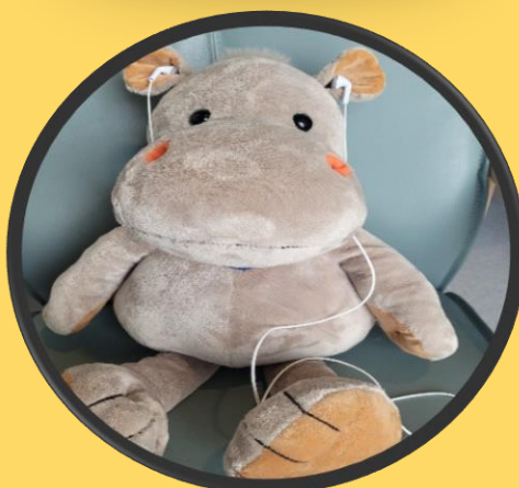
Høre på musikk