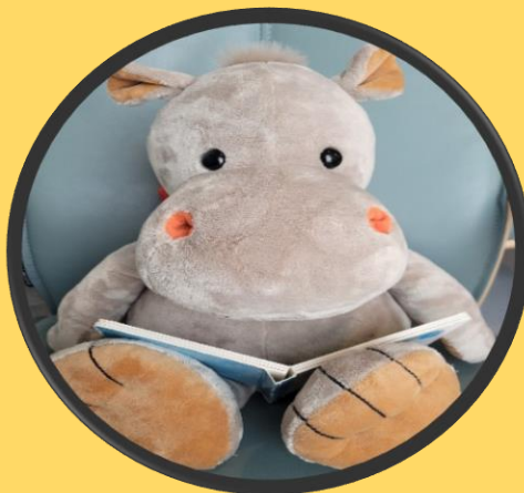
Lese en bok