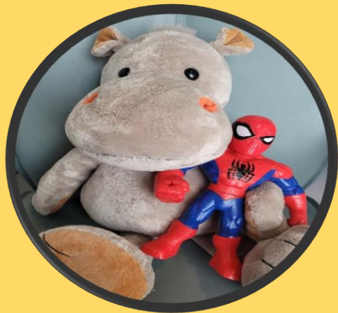
Ha bamse på fanget