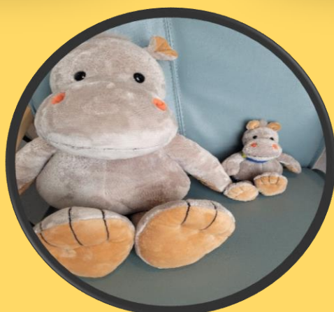
Holde i hånden