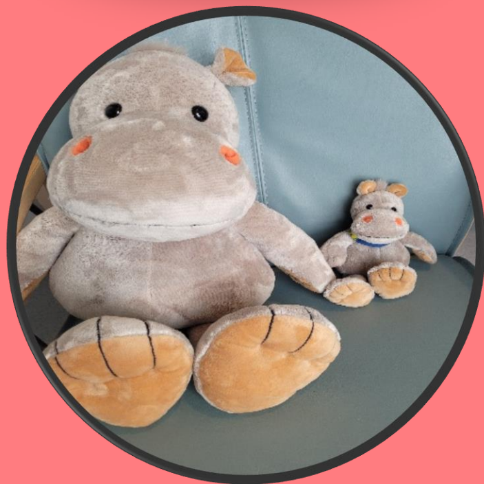
Holde i hånda