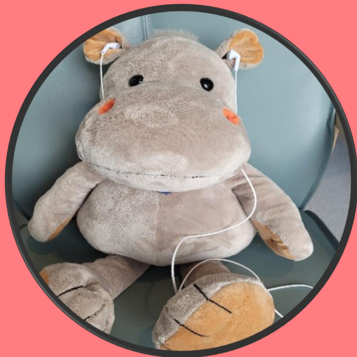
Høre på musikk