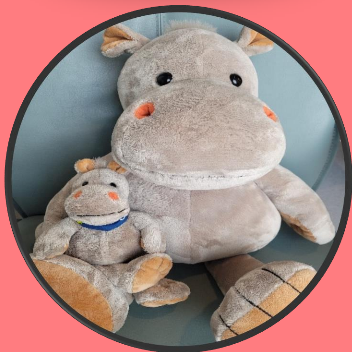
Sitte på fanget