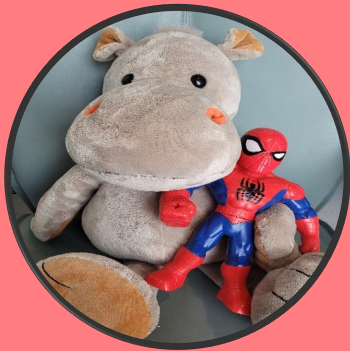
Ha bamse på fanget

Her er noen lure ting du kan gjøre når du skal få sonde. Hva har du lyst å gjøre?