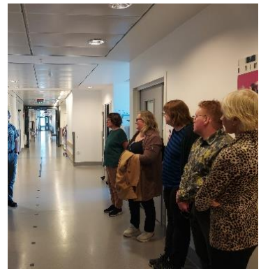
Møtet 24. august ble gjennomført på Nordlandssykehuset Vesterålen. Brukerutvalget fikk omvisning på døgnerhabiliteringsenheten og presentasjon av Nordlandssykehuset Vesterålen.

Møtedatoer er tilgjengelig i aktivitetskalenderen og referat legges ut på Nordlandssykehusets hjemmeside .