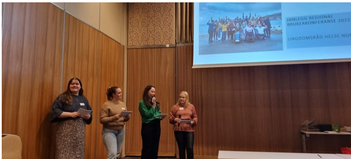
Representanter fra ungdomsrådene i Helse Nord holdt innlegg på brukerkonferansen, september 2022