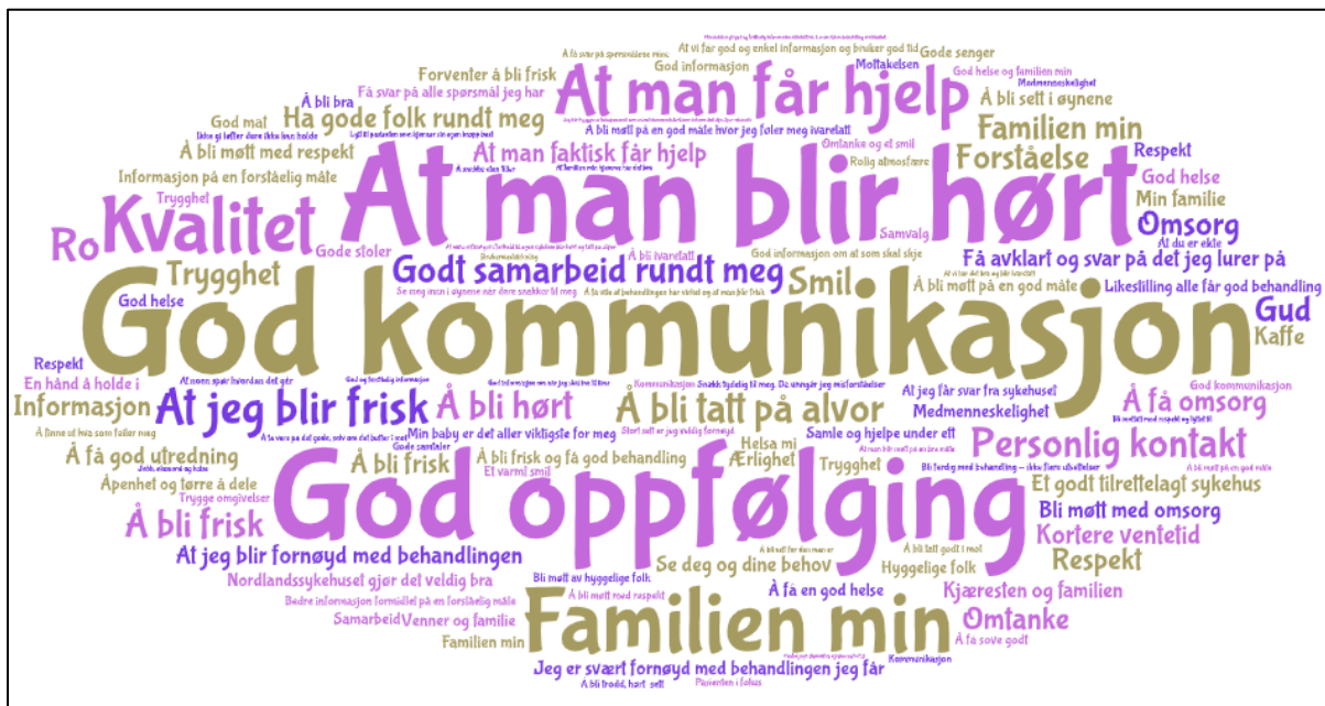
Tilbakemeldinger fra pasienter og pårørende på spørsmålet «Hva er viktig for deg»? 2022