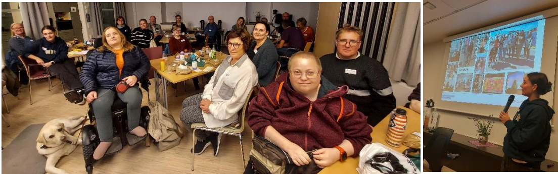
Kurs for brukermedvirkere ble gjennomført i november 2022.