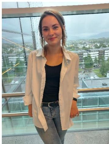
Innlegg for leger i spesialisering om samisk språk- og kulturkompetanse gjennomført 31. august.

Innlegg om brukermedvirkning dialog- og partnerskapsmøtet. «Reell brukermedvirkning i helsefelleskapet» og det er satt av 10 minutter