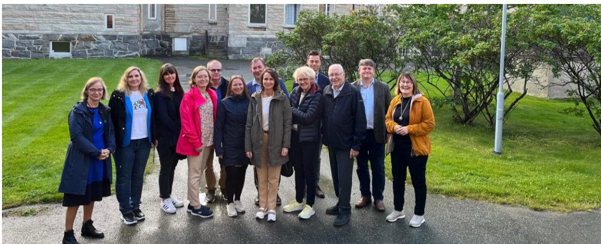
Styrem te i psykisk helse- og rusklinikken 31.08.2022. Brukerutvalgets leder har fast plass i styret som observat r med tale- og forslagsrett