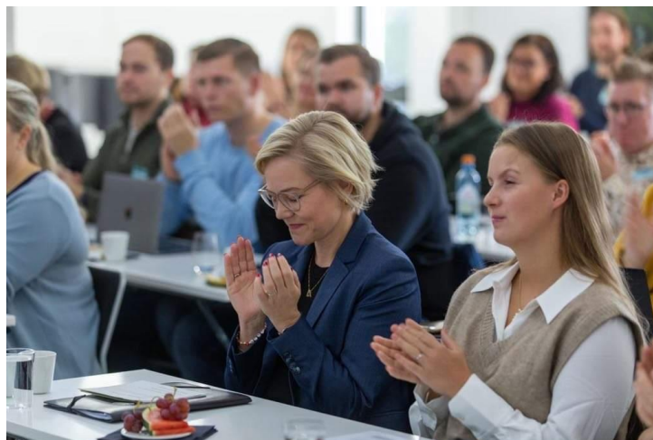
Helseinnnovasjonsuka 2022.