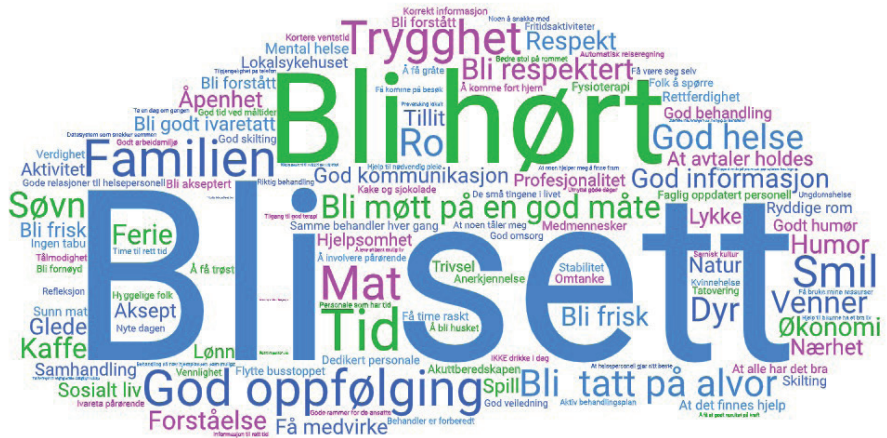
Tilbakemeldinger fra pasienter og pårørende på spørsmålet «Hva er viktig for deg»? 2023.