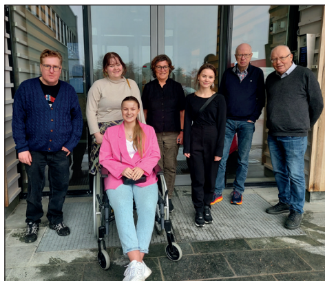
Brukerutvalget samlet i Lofoten.