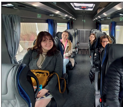
Brukerutvalget ble hentet på flyplassen av pasientreiser sin buss.