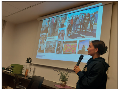
Kurs for brukermedvirkere ble gjennomført i november 2022.