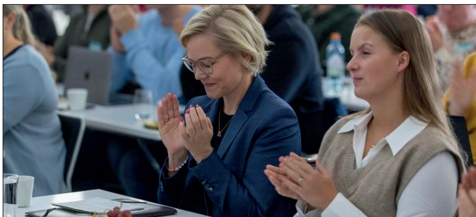
Helseinnovasjonsuka 2022.