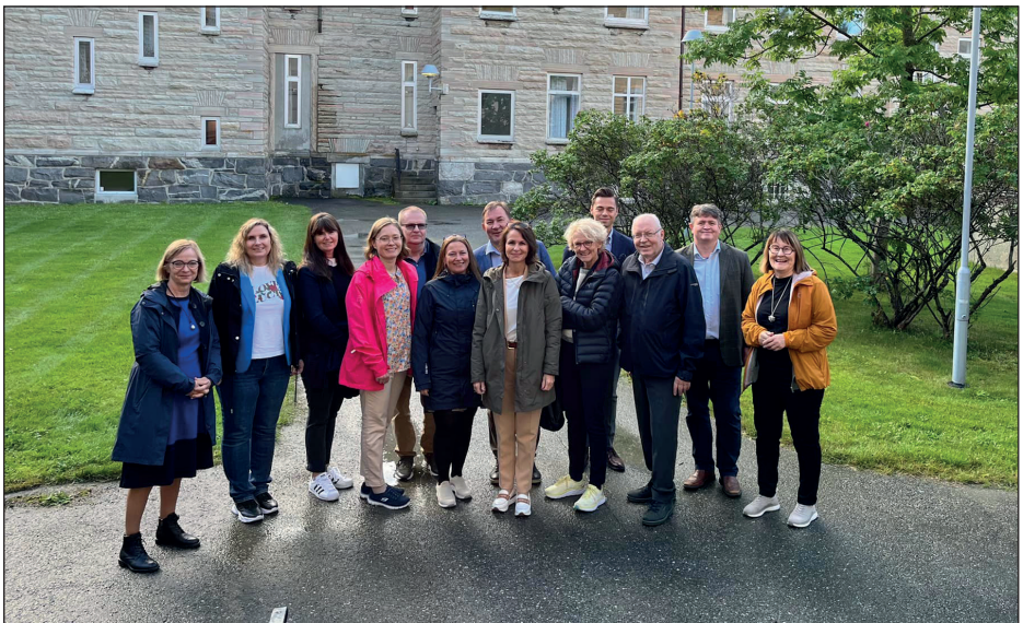
Styremøte i psykisk helse- og rusklinikken 31.08.2022. Brukerutvalgets leder har fast plass i styret som observatør med tale- og forslagsrett