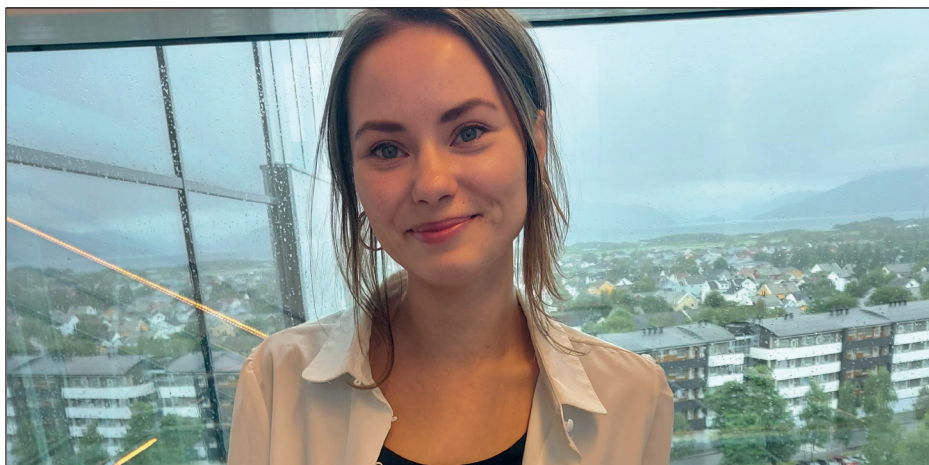
Innlegg for leger i spesialisering om samisk språk- og kulturkompetanse gjennomført 31. august.