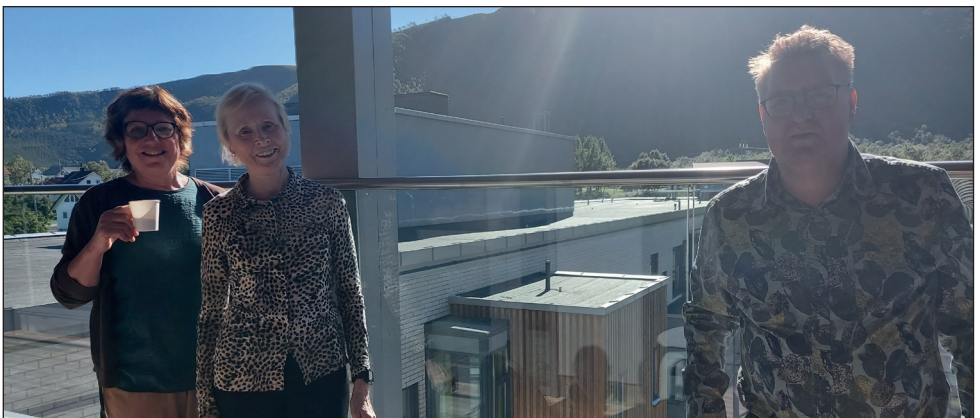
Møtet 24. august ble gjennomført på Nordlandssykehuset Vesterålen. Brukerutvalget fikk omvisning på døgnerhabiliteringsenheten og presentasjon av Nordlandssykehuset Vesterålen.

Møtedatoer er tilgjengelig i aktivitetskalenderen og referat legges ut på Nordlandssykehusets hjemmeside .