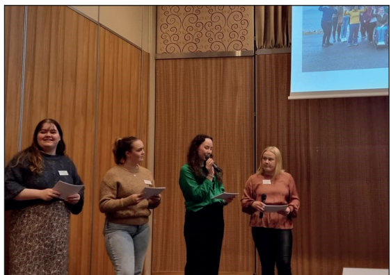
Representanter fra ungdomsrådene i Helse Nord holdt innlegg på brukerkonferansen, september 2022