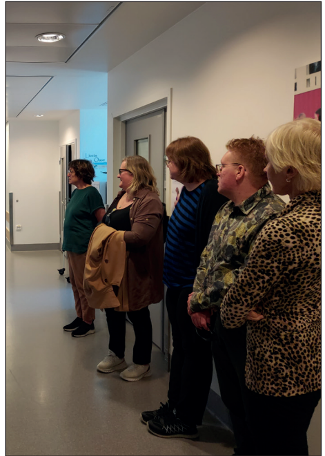
Fra omvisningen 24. august.