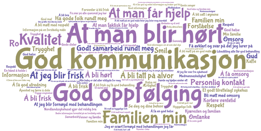
Tilbakemeldinger fra pasienter og pårørende på spørsmålet «Hva er viktig for deg»? 2022