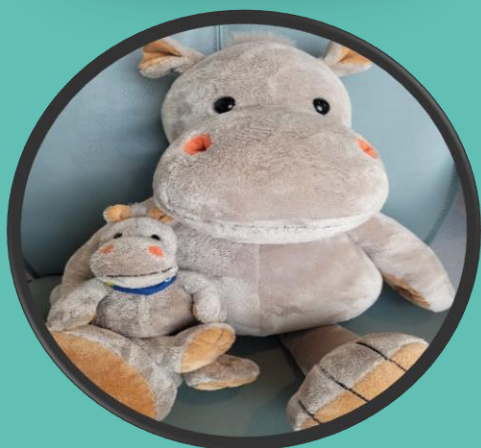
Sitte på fanget