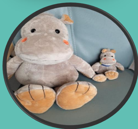
Holde i hånden