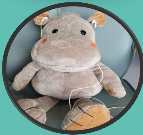
Høre på musikk