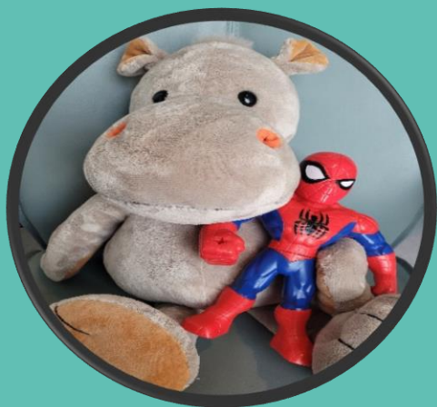
Ha bamse på fanget

Her er noen lure ting du kan gjøre når du skal få venflon. Hva har du lyst å gjøre?