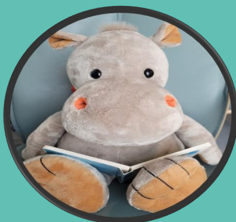
Lese en bok