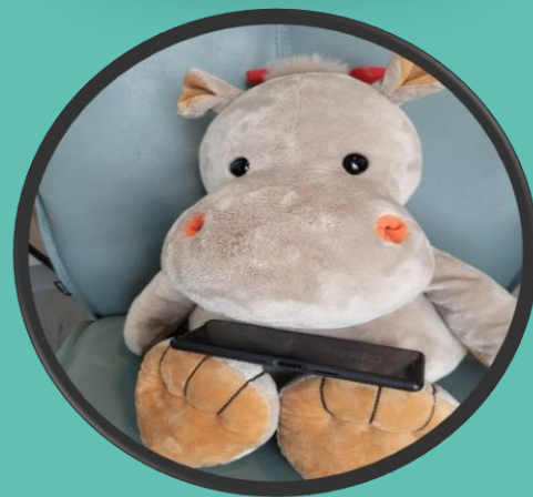
Se på telefonen